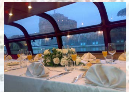
M / N Agrippina Maggiore allestimento per gruppo chiuso fino a 10 ospiti

L'allestimento standard comprende cocktail lounge con divani, cuscini, piante, lampade, tappeti, accessori e fiori freschi; su richiesta è possibile includere musica dal vivo di qualsiasi genere, animazione e molti altri dettagli.